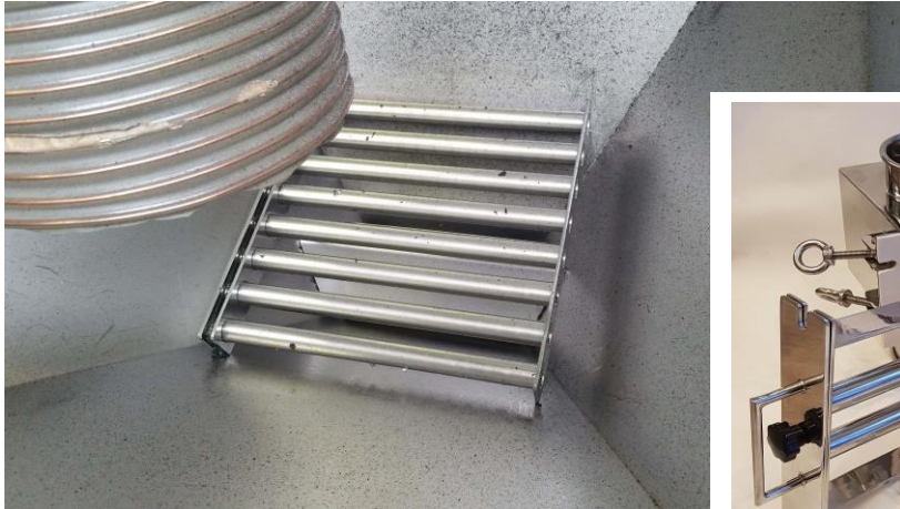
Beispiel: NMG-EEC 446*446 y8 in einer Abfüllanlage