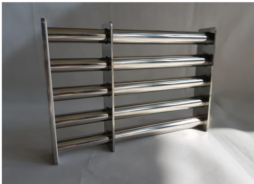
Beispiel: NMG-EEC 296*296 y5 mit halb herausgezogenen Magnetstäben

Man kombiniert für eine 2 lagige Ausführung wie folgt: (Länge / Breite) aus Tabelle EC-L1 (Länge / Breite) aus Tabelle EC-L2